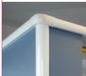
Finition d'angle arrondie en aluminium

Cabines sanitaires pour jardins-d'enfants