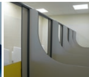
La surveillance facilitée