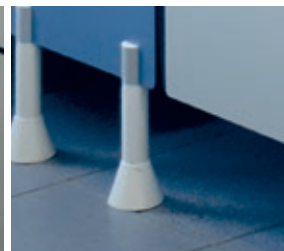
Pied vérin en nylon