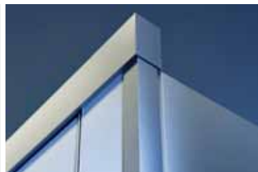
Stabilisateur en aluminium