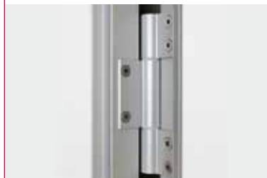
Paumelle aluminium avec une fermeture automatique