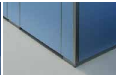
Support en aluminium, montage au sol