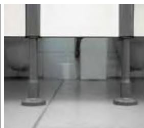
Pied vérin en aluminium