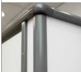
Finition d'angle arrondie en aluminium