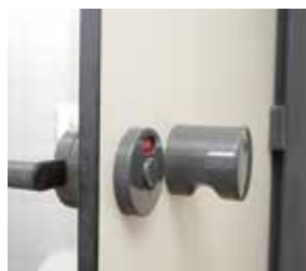
Bouton de porte fixe et verrou en nylon