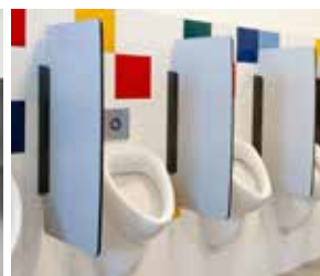
Séparations d'urinoirs assorties aux cabines